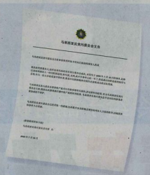
●阿布坎欣在本月15日早有的发表华文文告，向社家致意。

这名称自今年1月1日起担任反贪会主席一职的资深华裔官员，看重反贪会形象被撼时福耀加入会，反贪会上上下下都紧张兮兮，他与属下开始四处寻找解决途径，收集各方的意见。